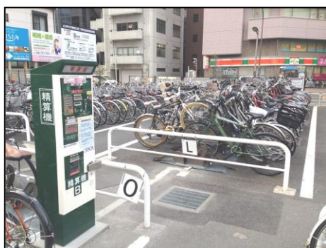
電磁ロック式駐輪機の導入

・立川駅北口第一有料自転車駐車場／・立川駅北口臨時有料自転車駐車場／・立川駅北口第三有料自転車等駐車場／・立川駅西地下道有料自転車駐車場／・立川駅南口第一有料自転車駐車場／・立川駅南口第二有料自転車等駐車場／・立川駅南口第三有料自転車駐車場／・立川駅南口第四有料自転車駐車場／・立川駅南口立体有料自転車駐車場／・立川駅南口第一タワー有料自転車駐車場／・立川駅南口第二タワー有料自転車駐車場／・西立川駅有料自転車駐車場／・西国立駅第一有料自転車駐車場／・西国立駅第二有料自転車等駐車場／・西国立駅第三有料自転車駐車場／・武蔵砂川駅第一有料自転車等駐車場／・武蔵砂川駅第二有料自転車等駐車場／・西武立川駅北口有料自転車駐車場